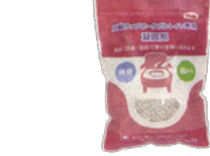
■専用凝固剤 1,000円(税抜)