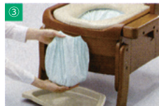
ラップ済み袋を取り出す

● 自動ラップ排泄処理ユニットを採用し、ボタン一つで専用フィルムで排泄物を密封します。 ● 汚れやすい部分はプラスチックで覆われて清掃しやすいです。