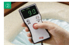
排泄後、作動ボタンを押す