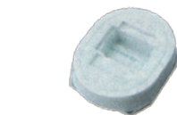
■専用フィルムカセット 2,000円(税抜)