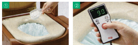
専用凝固剤を入れる