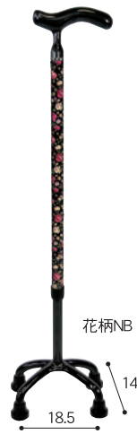
オールカーボン クオッドケイン四点式