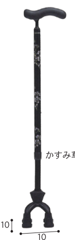
カーボン四点可動式 スモールタイプ