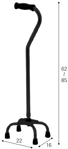
四点支持杖 スモールベース