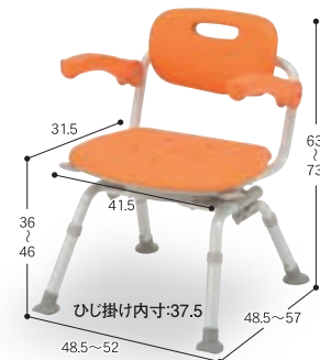
② ミドルSP回転おりたたみN