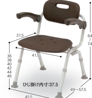
③ ミドルSPおりたたみN