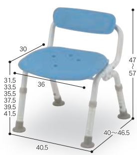
⑬ コンパクト腰当付おりたたみN