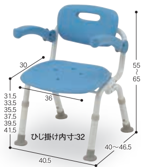
① コンパクトSPおりたたみN