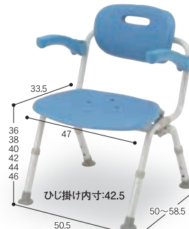
⑤ ワイドSPおりたたみN