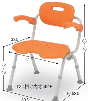
⑦ ワイドSP U型おりたたみN