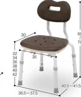
⑯ コンパクトスツール背付N