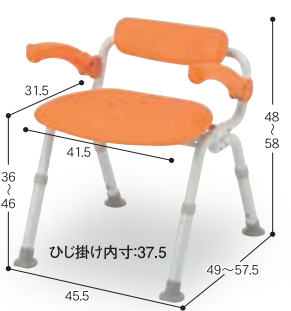
⑭ ミドルSP腰当付おりたたみN