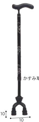
カーボン四点可動式 スモールタイプ