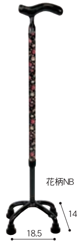
オールカーボン クオッドケイン四点式