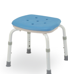
⑮ コンパクトスツールN