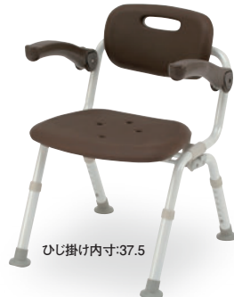
ひじ掛け内寸:37.5 ③ ミドルSPおりたたみN