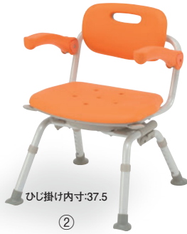
ひじ掛け内寸:37.5 ② ミドルSP回転おりたたみN