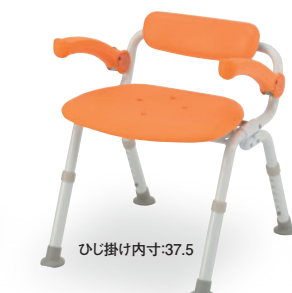
ひじ掛け内寸:37.5 ⑭ ミドルSP腰当付おりたたみN