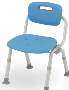
⑨ コンパクトおりたたみN