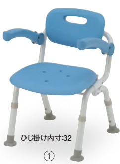
ひじ掛け内寸:32 ① コンパクトSPおりたたみN