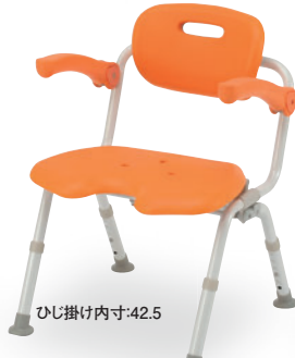
ひじ掛け内寸:42.5 ⑥ ワイドSPワンタッチおりたたみN