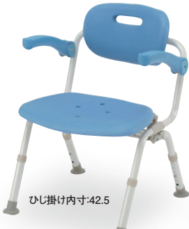
ひじ掛け内寸:42.5 ⑤ ワイドSPおりたたみN