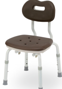
⑯ コンパクトスツール背付N