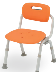
⑪ ミドルおりたたみN