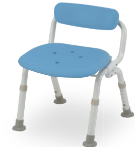
⑬ コンパクト腰当付おりたたみN