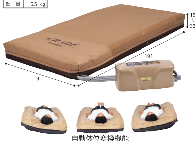
自動体位変換機能