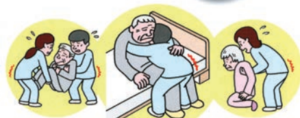
介護する家族や介護職の腰痛予防に 福祉用具は役立つと思うか？